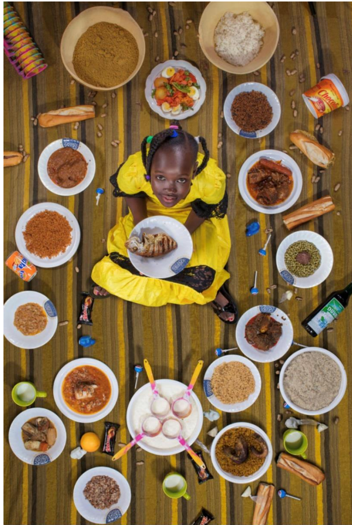
Una de las imágenes del proyecto de Gregg Segal