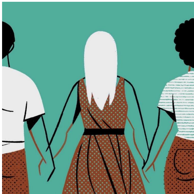
Ilustración de Carla Berrocal para Radio Ambulante

escuchando en bucle. Esta lista la hemos hecho para escucharla en los ratos tranquilos que tengamos en agosto. No estaremos juntas este agosto pero la música nos hará estar en el mismo lugar imaginado.